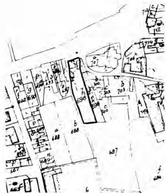
Schets II huidig