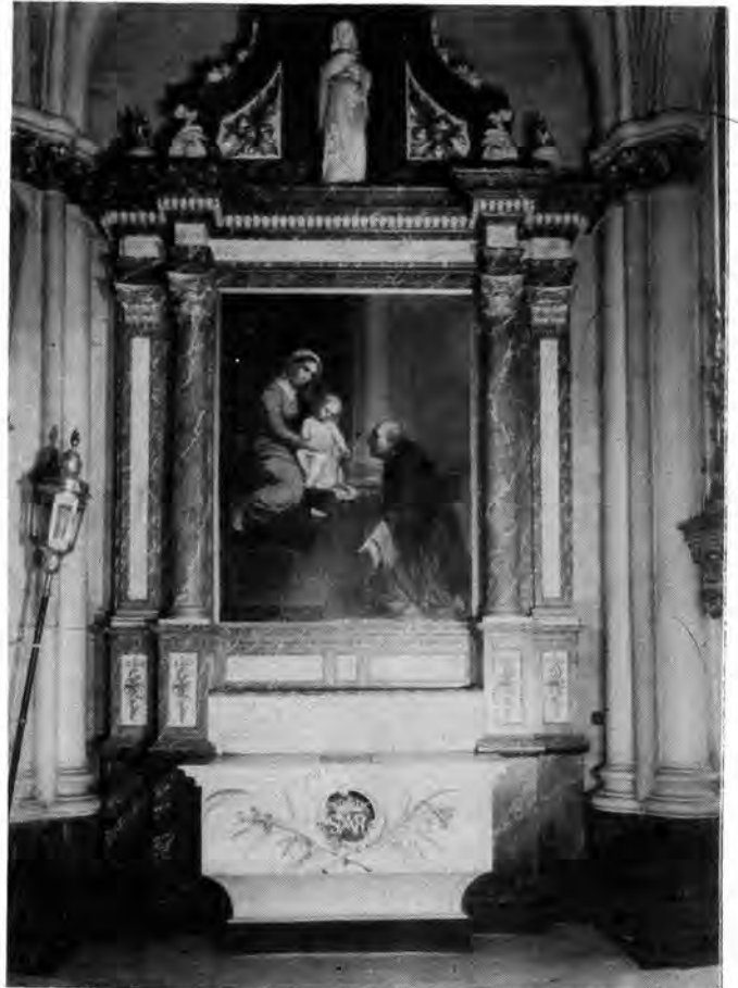
Portiekaltaar toegewijd aan O.L. Vrouw, tafel met gekroond Mariamonogram, schilderij: O.L.Vrouw met Kind schenkt de rozenkrans aan de H. Dominicus Guzman, in fronton beeld van O.L.Vrouw, XVIII*, gemarmerd hout.

Staenders : er is heden 1861 eenen houten staender om offerkeerssen op te branden met ronde ijsere buysen en pinnen