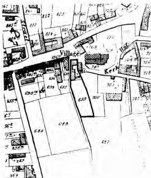
Schets I 1850