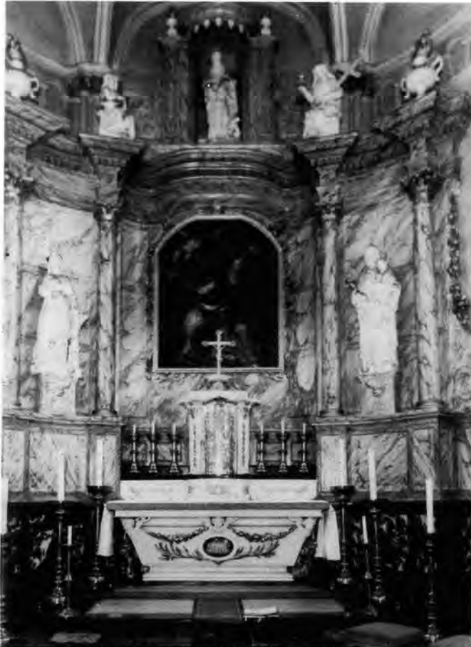
Altaar, Hoofd, tafel met het Krulsdragend lam, tabernakeldeuren met het Wimpeldragend lam en Hostledragende kelk, schilderij: Opvoeding van Maria, kople naar Pieter Pauwel Rubens, gemarmerd hout.